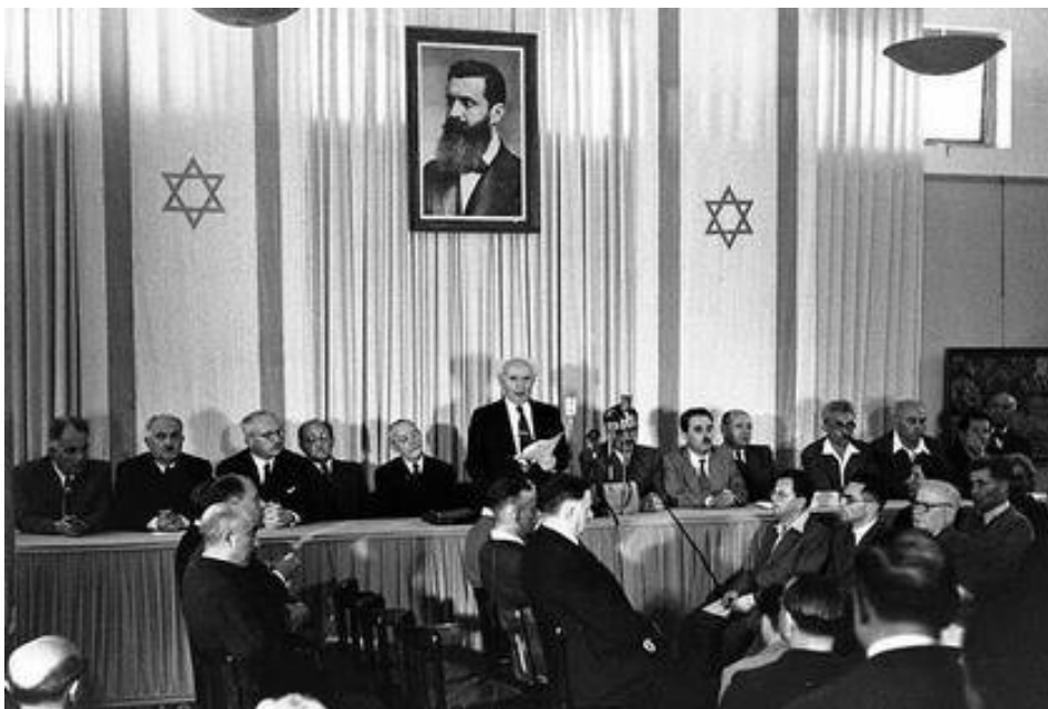
דוד בן-גוריון קורא את המגילה של הכרזת העצמאות ב-14 במאי, 1948 במוזיאון תל-אביב.

שלושה שבועות לפני הכרזת העצמאות של מדינת ישראל, לא נכתבה עדיין טיוטת ההכרזה. במהלכו של חודש אפריל, 1948, שורה של משפטים ופוליטיקאים הכינו את הטיוטה הסופית, ששיקפה את השפעתם של מחברים רבים ותכנים שונים, כמו הטיוטה לחוקה ישראלית (שנכתבה בינואר, 1948), הכרזת העצמאות של ארה"ב והחוקה האמריקנית. דוד בן-גוריון היה העורך הסופי של ההכרזה. החלטות פוליטיות שונות נידחו עד לרגע האחרון. בימים שקדמו להכרזה של הקמת המדינה, לא נתקבלה עדיין החלטה לגבי בירת המדינה; עדיין נותר להשלים את שילובם של ארגונים יהודים צבאיים במסגרת ממלכתית תחת פיקוד מרכזי; ומבצעים צבאיים, בעיקר סביב היישוב שבגוש עציון מדרום לירושלים, הסיחו את תשומת הלב מההכנה של טיוטת ההכרזה. בנוסף, בן-גוריון היה תחת לחץ עקב הדרישה מן הבית הלבן של הנשיא טרומן לקבל בקשה רשמית בכתב, כדי לקבל את ההכרה הרשמית של ארה"ב במדינה.