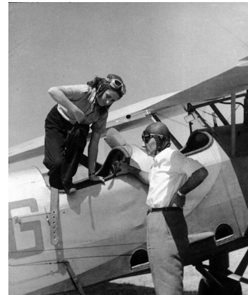
ישראלים מכשירים מטוס לקראת תחילתה הצפויה של מלחמת העצמאות.

תוכנה של ההכרזה היה תמצית ההיסטוריה היהודית עד 1948 והצהרת הכוונות של מדינת ישראל כלפי אזרחיה, שכניה והקהילה הבינלאומית. ההכרזה הייתה מורכבת מארבעה חלקים: הראשון, ההיבטים החוקיים להקמתה של מדינה יהודית בארץ ישראל על בסיס התנ"ך, ההיסטוריה והמציאות הבינלאומית. השנייה, הזכות המובנת מאליה של העם היהודי לשאוף להקמת מדינה. השלישית, ההכרזה על הקמת המדינה. הרביעית, הצהרה המפרטת כיצד תפקד המדינה, כולל פירוט הזכויות של אזרחיה. כן נאמר, שעל בסיס החלטת האו"ם שהעניקה הכרה בינלאומית להקמת מדינה יהודית ומדינה ערבית בארץ ישראל, מוכרת הנחיצות להכנת חוקה למדינה. אולם, היעד של כתיבת החוקה נידחה בחודש יוני, 1950, לתקופה בלתי-מוגבלת.