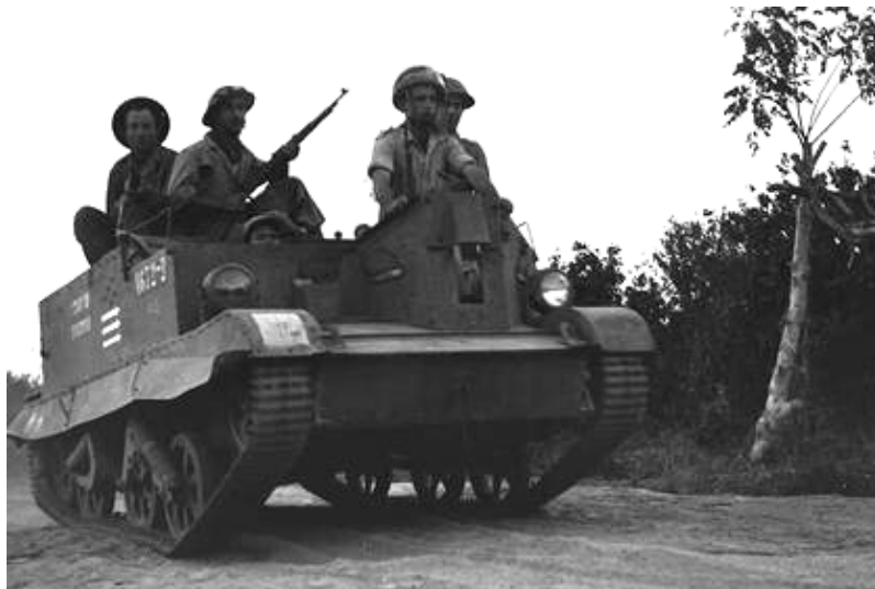
חיילים ישראלים מפעילים טנק מצרי שנלקח שלל במהלך מלחמת העצמאות ב-1948.

הכרזת העצמאות של מדינת ישראל מכילה שורה של נימוקים היסטוריים לזכות על ארץ ישראל. ההכרזה מציינת אירועים היסטוריים ששימשו כנקודות מפנה בהן הקהילה הבינלאומית אישרה את הלגיטימיות של מדינה יהודית, ובמיוחד ההכרה של חבר הלאומים ב-1922 בזכות ההקמה של בית לאומי והחלטת האו"ם ב-1947 להקים מדינה יהודית. בעוד שהיו קרבות ועימותים בין האמריקנים לבין הבריטים בעת שהצהרת העצמאות האמריקנית נחתמה ב-1776, הרי בעת שישאל הכריזה על עצמאותה היא הייתה בעיצומה של מלחמת-קיום כוללת נגד האוכלוסייה הערבית המקומית והמדינות הערביות השכנות. חרף מלחמת האזרחים, הכרזת העצמאות הישראלית כוללת הצהרה המציעה "שלום ויחסי ידידות" לשכנותיה ופנייה "לשוב אל דרכי השלום". שתי ההכרזות מתייחסות להשגחה העליונה: הישראלית אינה מזכירה את נושא הדת אך חותמת עם המשפט "מתוך בטחון בצור ישראל." (זוהי התייחסות לאלוהים בספר שמואל ב', פרק כ"ג פסוק ג').